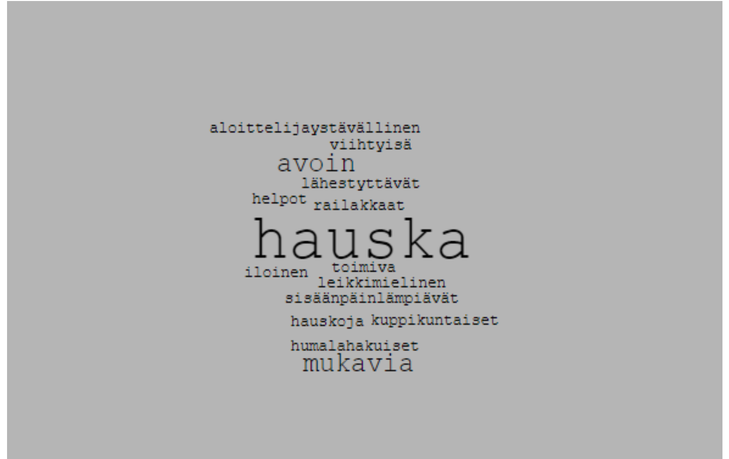
Kuvio 2. sanapilvi seuran juhlien ja ilmapiirin kuvailuun käytetyistä adjektiiveista